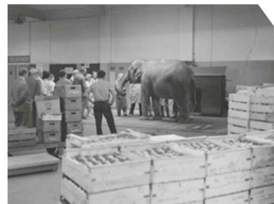
Die Elefantinnen und Elefanten aus dem Basler Zoo kamen regelmässig zum Wiegen ins Untergeschoss der Markthalle, wie hier um 1965/70.

Natürlich gibt es auch die eine oder andere Markthallen-Anekdote aus fast 80 Jahren. Besondere Ereignisse waren zum Beispiel die regelmässigen Besuche der Zolli-Elefanten im Untergeschoss der Markthalle. Die exotischen Tiere mussten sich dort auf die grosse Waage stellen, die eigentlich zum Wiegen der Lastwagen mit und ohne Ware gedacht war. Erheblicher Sachschaden entstand am 27. Mai 1996 bei einem Brand in der östlichen Randbebauung gegenüber dem Bahnhof SBB.